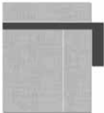
Hockeystick, Wallpaper oder Tandem-Ad