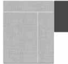
Skyscraper oder Halfpage