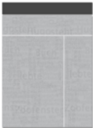
Superbanner oder Billboard