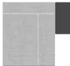
Skyscraper oder Halfpage